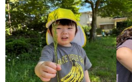
3歳児 かえて組 園庭で草花GET！