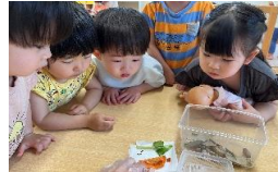
2歳児 みのり組 カタツムリの観察中！