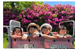
1歳児 めばえ組 ツツジきれいな♪