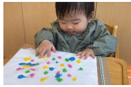
0歳児 つばみ組 絵の具の感触楽しい♡